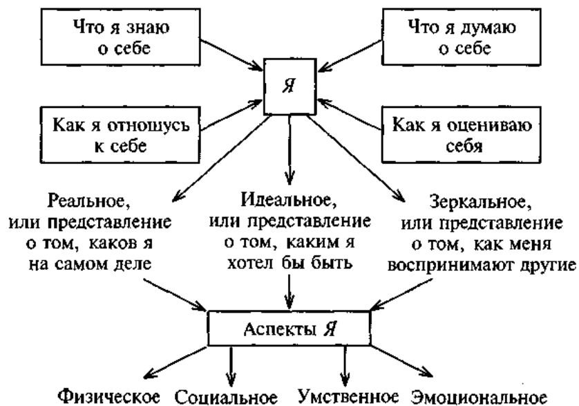
Рис. 2. Структура Я-концепции

ее характерные особенности. Схематически структуру Я-концепции можно изобразить следующим образом (рис. 2):